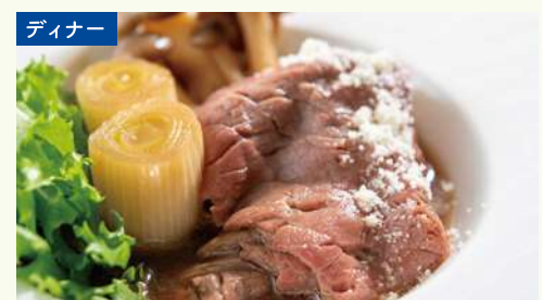
オーストラリア和牛のイタリア風すき焼き オーストラリア和牛にチーズのコクとオリーブオイルの風味を 合わせた、イタリア風すき焼き。