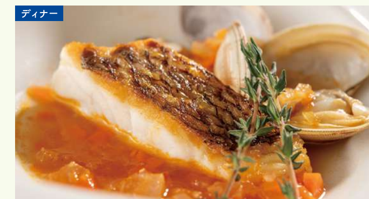
イタリア版ブイヤベース リヴォルノ風 香ばしく焼き上げた鯛の旨みを、魚介のスープとともに。