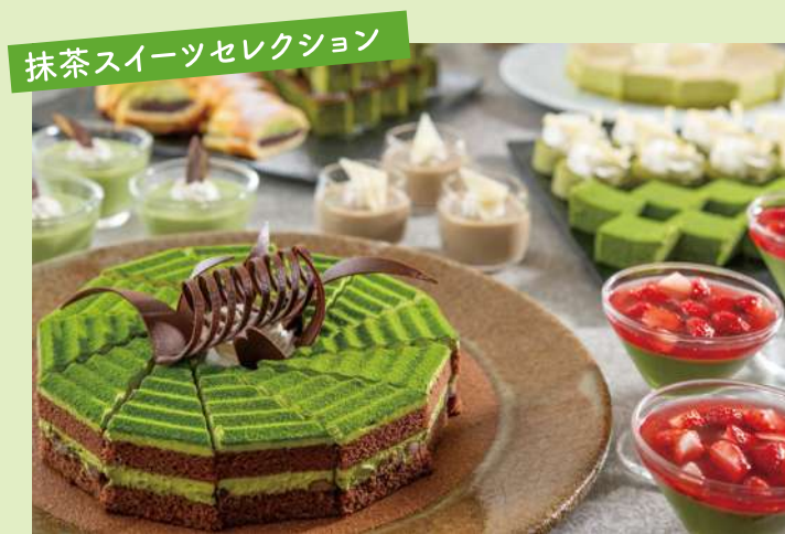
抹茶プリンやテリーヌ、ブラウニーなど、香り豊かな抹茶スイーツをご用意しました。