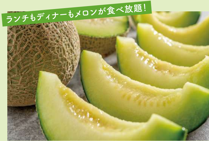
みずみずしい旬のメロンを心ゆくまでお楽しみください。