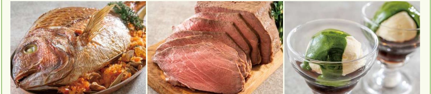
イタリア版ブイヤベース リヴォルノ風 香ばしく焼き上げた鯛の旨みを丸ごと味わう、 ブイヤベース リヴォルノ風。 すき焼き風ローストビーフ すき焼き風の味わいで仕上げたローストビーフ。 しっかりとした肉の旨みをお楽しみください。 抹茶フォガート アフガート風に仕立てた抹茶デザート「抹茶フォガート」。