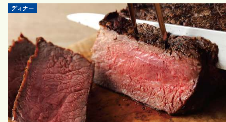
高温で焼き上げた牛サーロイン 900°Cの超高温グリルで香ばしく焼き上げるビーフステーキが食べ放題