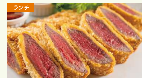
牛肉のミラノ風カツレツ 牛肉の旨みを閉じ込めたミラノ風カツレツ。 2種類のソースでお召し上がりください。