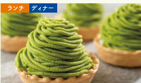
抹茶モンブラン 抹茶の風味を楽しむモンブラン。なめらかな抹茶クリームと、 軽やかなタルト生地のお楽しみください。