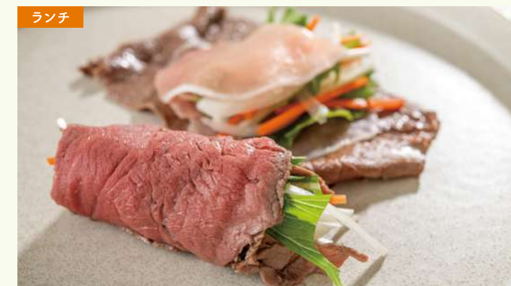
オーストラリア和牛と生ハムのサルティンボッカ風 オーストラリア和牛に生ハムを合わせた、サルティンボッカ風の一品。 ※5/2～5/10は、すき焼き風ローストビーフのご提供に変更となります。