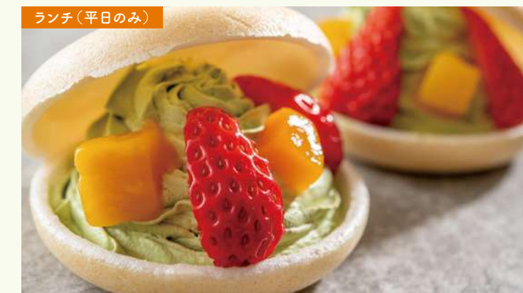
最中の抹茶リトッツォ 最中で仕立てた、抹茶クリームの抹茶リトッツォ。 サクとした最中と、ふわっと軽い抹茶クリームの組み合わせ。