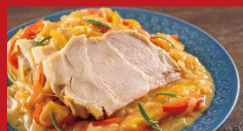
スマザードポーク