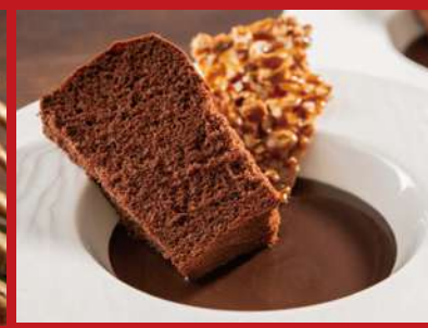
チョコレートシフォンケーキに 背徳量のチョコレートソースを