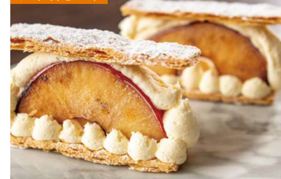
フローズンアップルパイ NBKスタイル