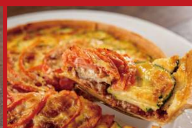
シカゴピザに見立てた挽肉と野菜の セイボリータート