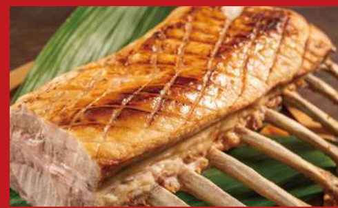
千葉県産 東の匠 SPF 豚 骨付き背肉の低温ロースト