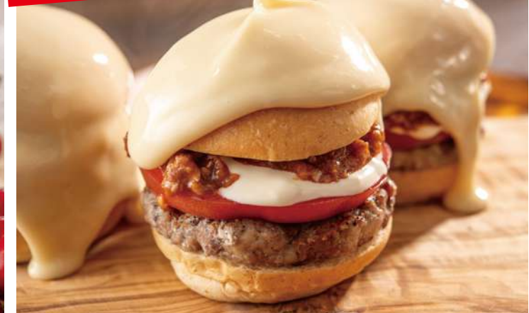
チーズたっぷり、背徳感あふれるNBK バーガー。