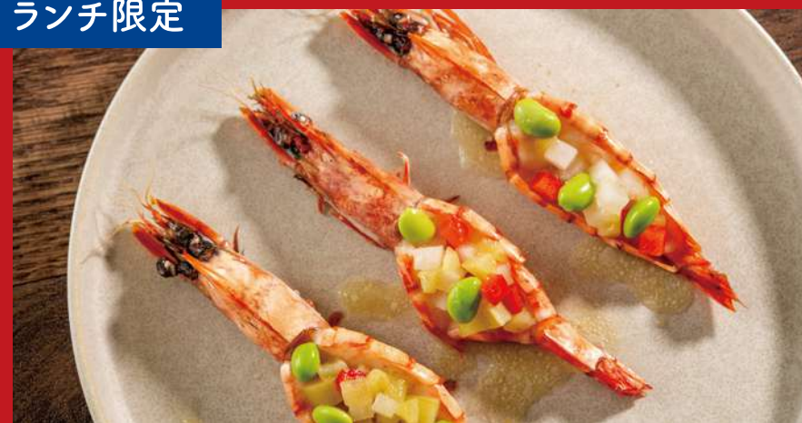
ガーリックでマリネしたヘッド・オン・シュリンプのロースト