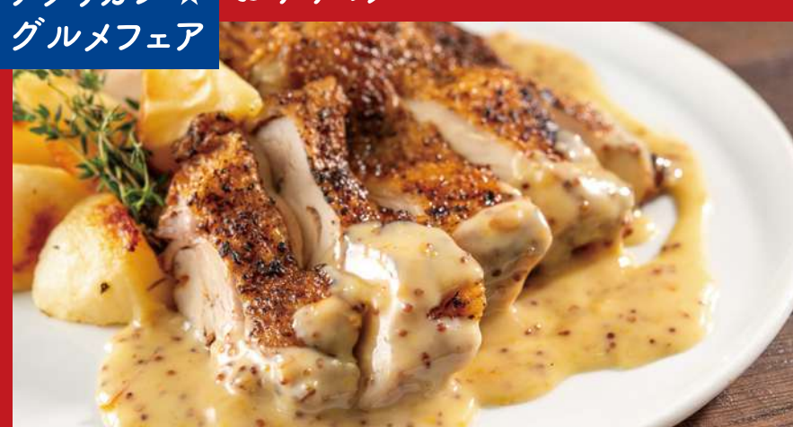
スパイシーな鶏もも肉のソテー マスタードオレンジのクリームソース