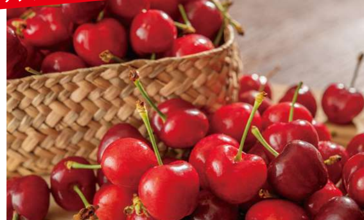
旬のアメリカンチェリーを贅沢に食べ放題。